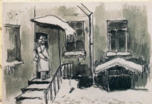
Д. П. Бучкин. «У входа в бомбоубежище». Лист из альбома «Блокадный Ленинград». 1941–42

Мама сидела со мной. И была очень благодарна патронажным сестрам, которые не прекращали ходить по домам даже в блокаду. Мама рассказывала: «Сама (медсестра) еле ползет, а раз в неделю поднималась по нашей лестнице и выясняла, жив ли младенец? Учет младенцев в городе был налажен». Я вначале вопила, а под конец 41-го только стонала: не было сил. Кормящим матерям никакого дополнительного питания не было. Но в 41-42-х годах уже начала поступать американская помощь, например, соевое молоко. Но я не могла пить это молоко, меня рвало. Поэтому мама смогла все же выпросить 50 г настоящего молока (ноябрь-декабрь). У нас всех были иждивенческие карточки. Папа редко появлялся в городе, но старался прислать нам скудные продукты с кем-нибудь или сам. Это спасло нас. Каждый раз, когда мы получали посылочку от отца, радовались – значит, жив!