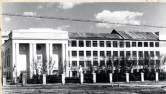
В здании Пединститута был размещен Инженерный факультет. Фото 1947 г.

К началу войны мне не было ещё и пяти лет. Мои родители работали в Ленинградской Краснознамённой Военно-Воздушной инженерной Академии (ЛКВВИА) (в качестве преподавателя, научного работника), базировавшейся в Авиагородке под Пулковом. К концу лета 1941 г., когда немцы подошли к Ленинграду, этот район подвергался интенсивным бомбардировкам и обстрелам, и работать там стало невозможно, и было принято решение об эвакуации Академии. Военный состав Академии был эвакуирован в г. Йошкар-Ола задолго до установления блокады со всем оборудованием в плановом порядке, а гражданские служащие (так называемые вольнонаёмные) уезжали самостоятельно.