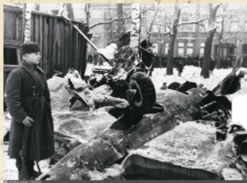
Сбитый самолет в Таврическом саду