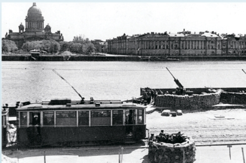
Зенитная батарея на Университетской набережной. 1942 г.