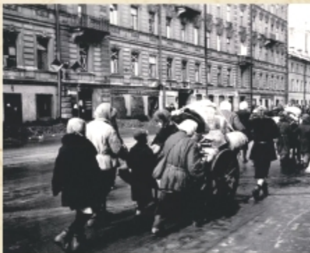
Эвакуируемые на Литейном проспекте

С вокзала мы собирались поехать к родителям моей мамы в г. Ленинград. Но началась паника, поезда напрямую не ходили. И ей пришлось на перекладных начать свой путь в Северную столицу. По дороге она боялась оставлять меня одну или с кем-то, ведь не знала, то ли она может погибнуть, то ли меня могут убить. Было страшно от авианалетов. Но, несмотря на это, она добралась до Ленинграда к своим родным. Через некоторое время враг наступил и там, и вновь эвакуация, дорога, неизвестность.