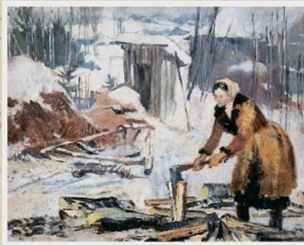
Пименов Ю. И. «Колка дров»

Собирали все, что могли. То есть голод был настоящий. Никакой живности не было. У соседей вот только были гуси. Я их очень боялась: они были такие громадные по сравнению со мной, и однажды заклевали меня по спине. До сих пор помню.