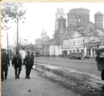
г. Орёл в годы оккупации