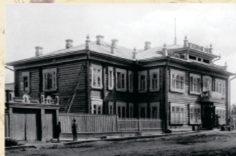
Штаб академии расположился в Доме колхозника. Фото 1930 г.

Мы (мама, бабушка и я) добирались до места самостоятельно чуть ли не целый месяц на перекадных (часто в необорудованных вагонах).