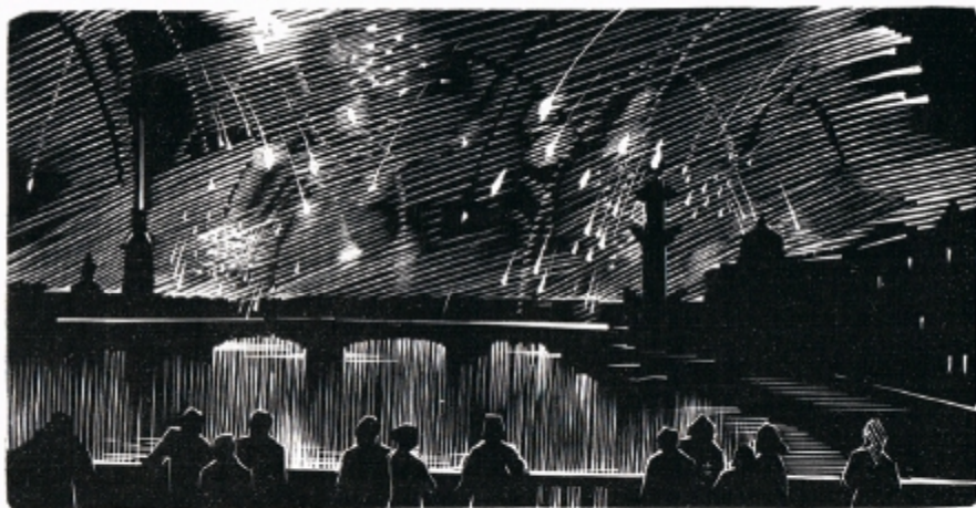
Салют в Ленинграде (День Победы). Линогравюра. Автор А.А. Ушин.

Брат бабушки (которая из немецкой семьи), был репрессирован как немец и выслан в ссылку в Воркуту. После войны он вернулся благодаря титаническим усилиям его жены, которая писала в разные инстанции. Он был специалистом и, приехав в Ленинград, устроился на ТЭЦ. Его дети были эвакуированы с каким-то детским домом во время войны и выжили.