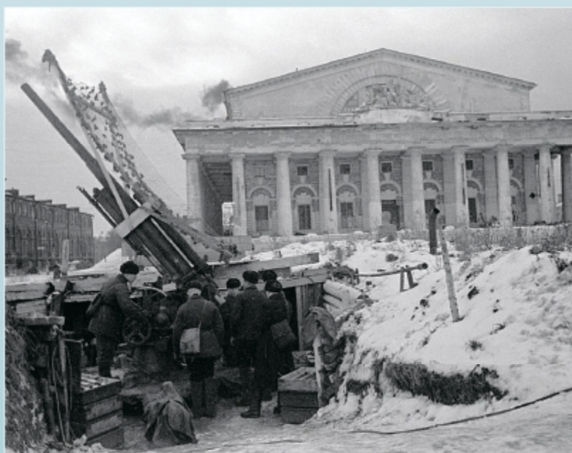
Зенитная батарея на Стрелке Васильевского острова. 1942-43 гг.