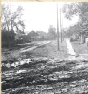
Вид на улицу Палантая. Место жительства сотрудников академии в Йошкар-Оле

Мы (мама, бабушка и я) добирались до места самостоятельно чуть ли не целый месяц на перекадных (часто в необорудованных вагонах).